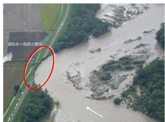
出水 (H23.9) で河岸侵食が進行し堤防が一部流出