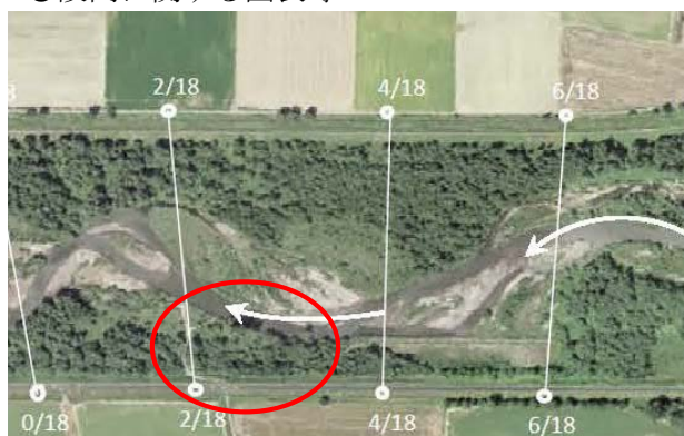
出水前の河道状況