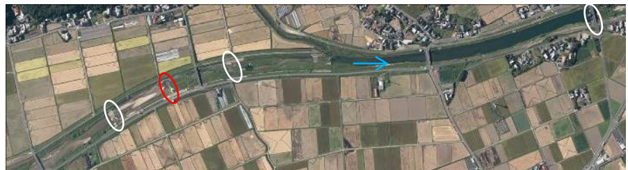
堰周辺状況(航空写真)