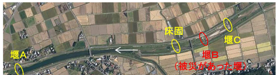
堰周辺状況(航空写真)