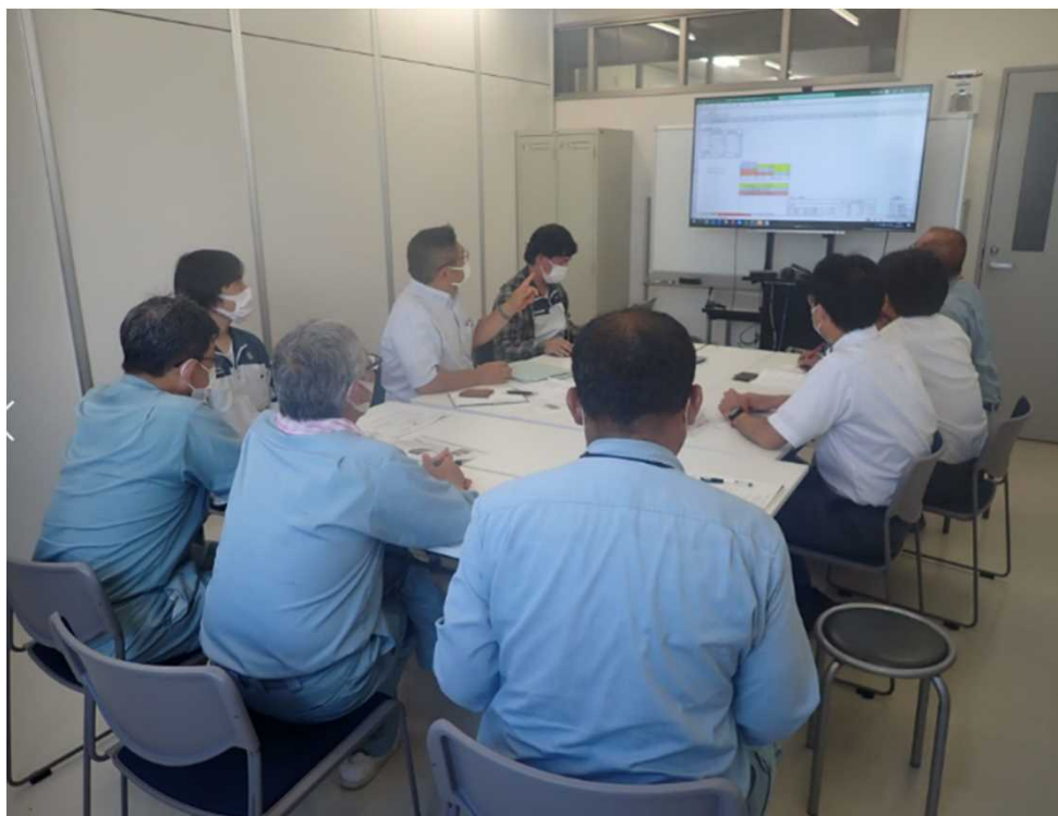
▲堤防点検受注者の勉強会

河川維持管理技術者が、堤防点検受注者に、現地調査における着眼点、評価方法について勉強会を実施し、評価結果の整合性の向上を図った。